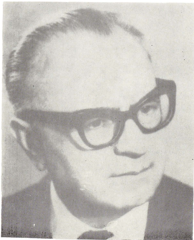
ANDREI OȚETEA 1894—1977